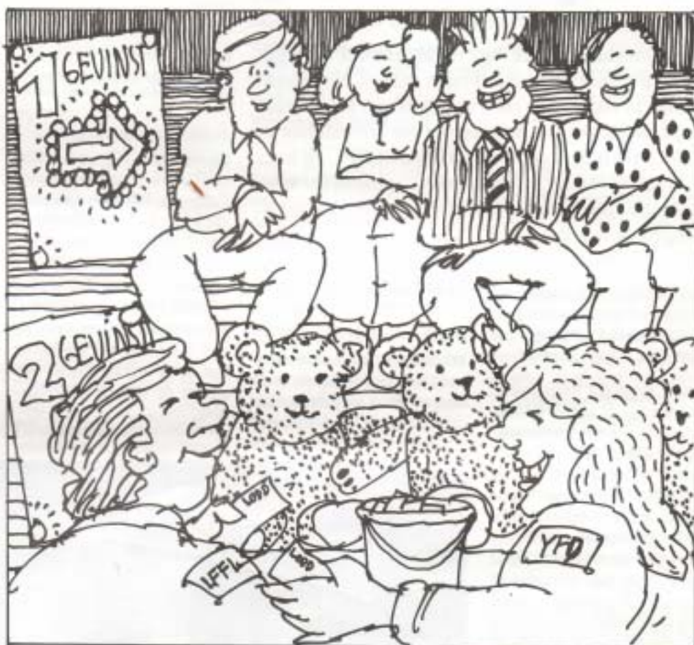
Skal løsemiddelskadde være gjenstander for et lotteri?

Jeg er litt "inhabil" i og med at jeg jobber i NHF, men gangsynet mister man ikke av den grunn. LFFLs formål er å spre informasjon om løsemidler, ivareta interessen for løse-