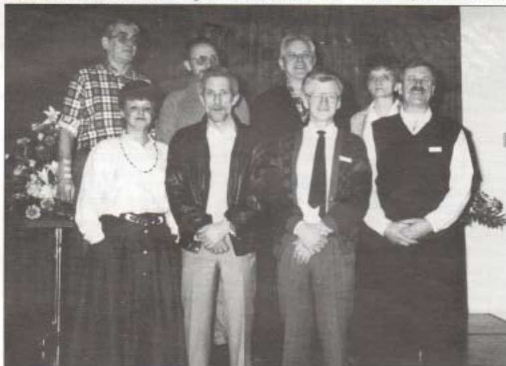
Dette er det nye styrets sammensetning etter LFFLs årskonferanse:

Hordalands andre forslag gikk ut på at "LFFL krever at Sosialdepartementet oppretter et fagråd sammensatt av en sosiolog, yrkesmedisiner og psykolog." Begrunnelsen er at et